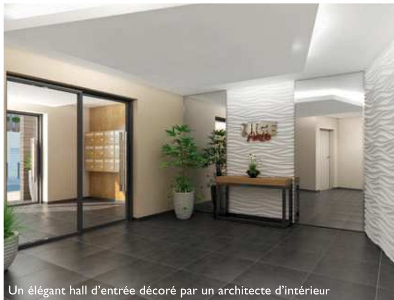
Un élégant hall d'entrée décoré par un architecte d'intérieur