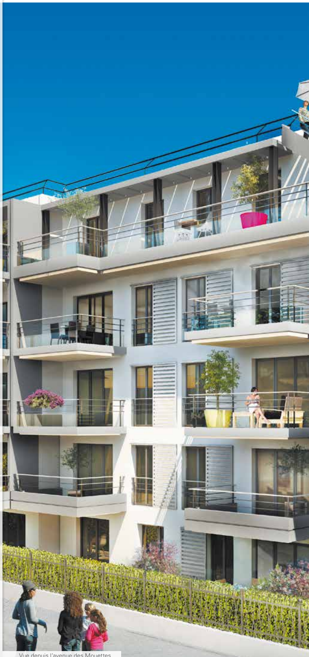
Vue depuis l'avenue des Mouettes

La RT 2012 offre des avantages concrets: Réduction de plus de 30 % par rapport à la RT 2005 des dépenses énergétiques à conditions d'usage et climatiques identiques