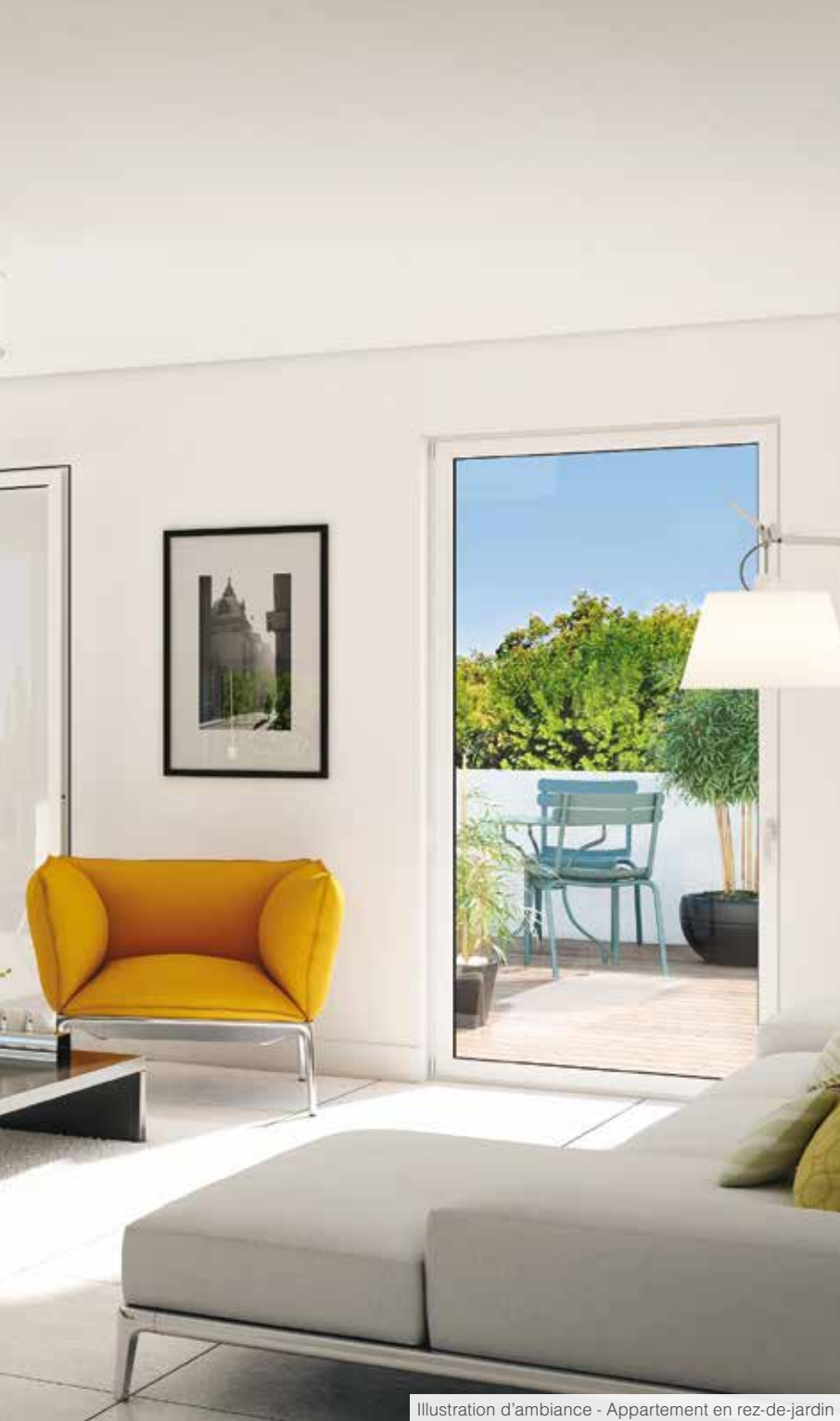
Illustration d'ambiance - Appartement en rez-de-jardin