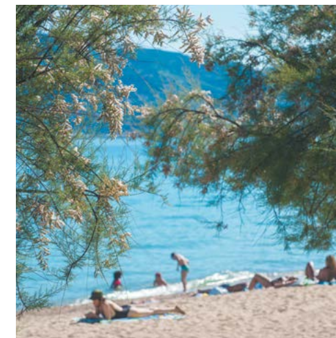
Plage à Cannes-la-Bocca