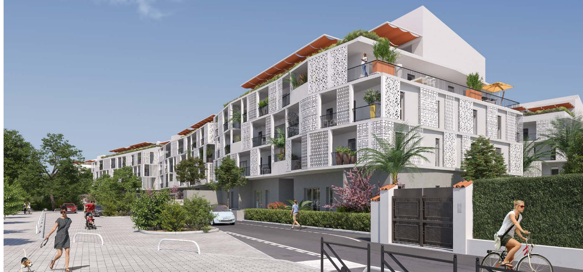
Vue de la résidence depuis la rue de Cannes

Chacun est doté de prestations de qualité et d'équipements sélectionnés avec soin, répondant aux derniers critères en matière de réglementation thermique et d'éco-construction.