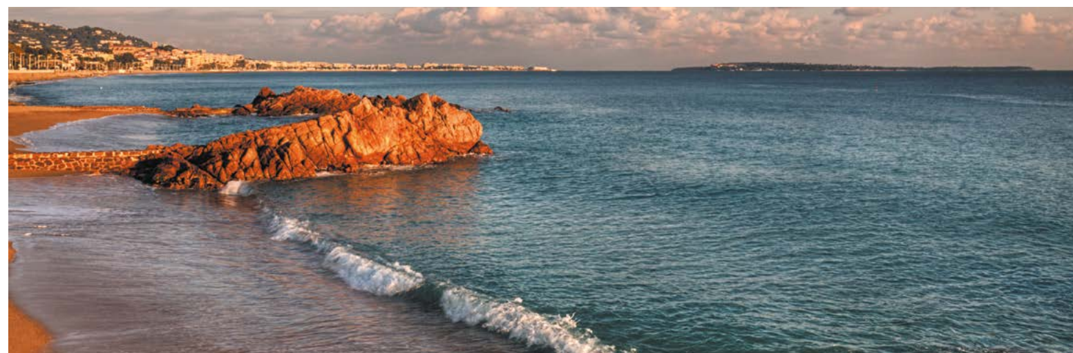
Les plages de sable de Cannes-la-Bocca