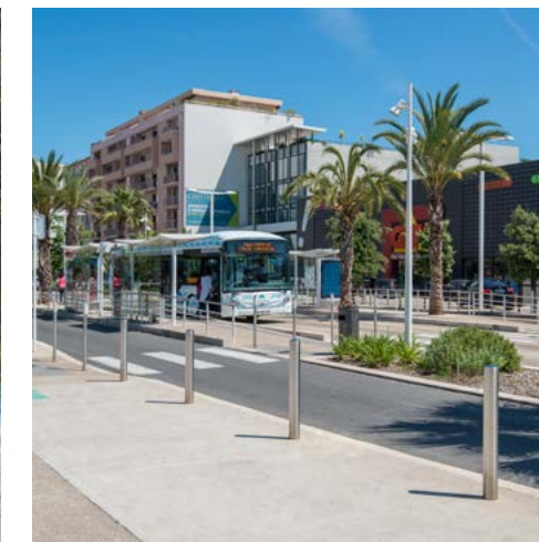
Avenue Francis Tonner