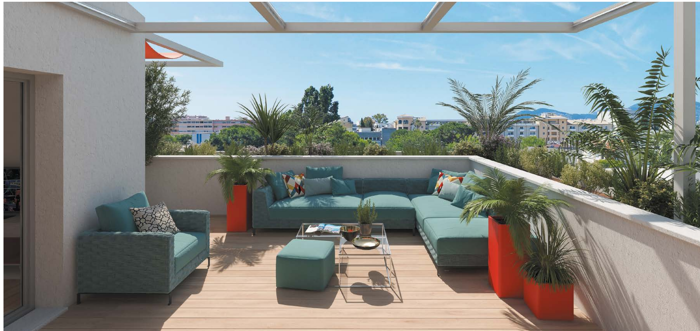
Vue d'un appartement avec terrasse situé au 4 e étage