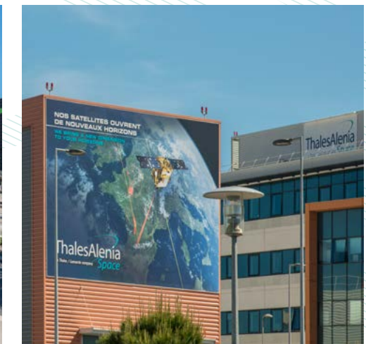
Thales Alenia Space

C 'est aussi un quartier qui porte les grandes évolutions et toute la modernité de Cannes. Entièrement rénové, de nombreux projets rythment son changement parmi lesquels le développement d'un réseau de transport en commun dédié, la valorisation de nombreux sites économiques, ou encore l'aménagement d'une médiathèque. Cet essor est favorisé par l'accès direct à l'autoroute A8, bientôt renforcé par un nouvel échangeur en direction de Nice.