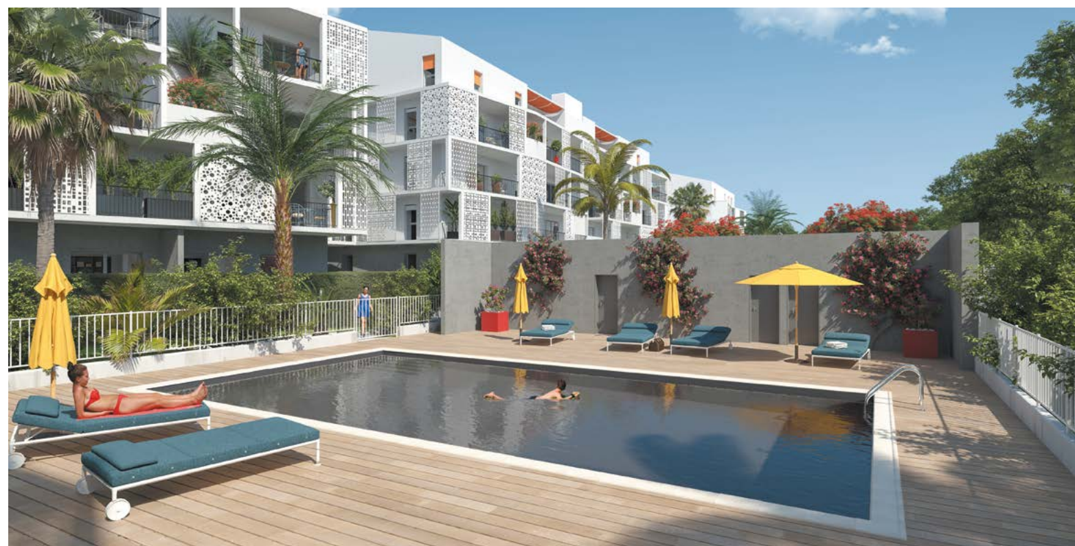
Vue de la piscine de la résidence Palma Bianca

La résidence Palma Bianca propose une belle piscine sécurisée, à laquelle on accède par une promenade bordée de beaux palmiers et d'agrumes.