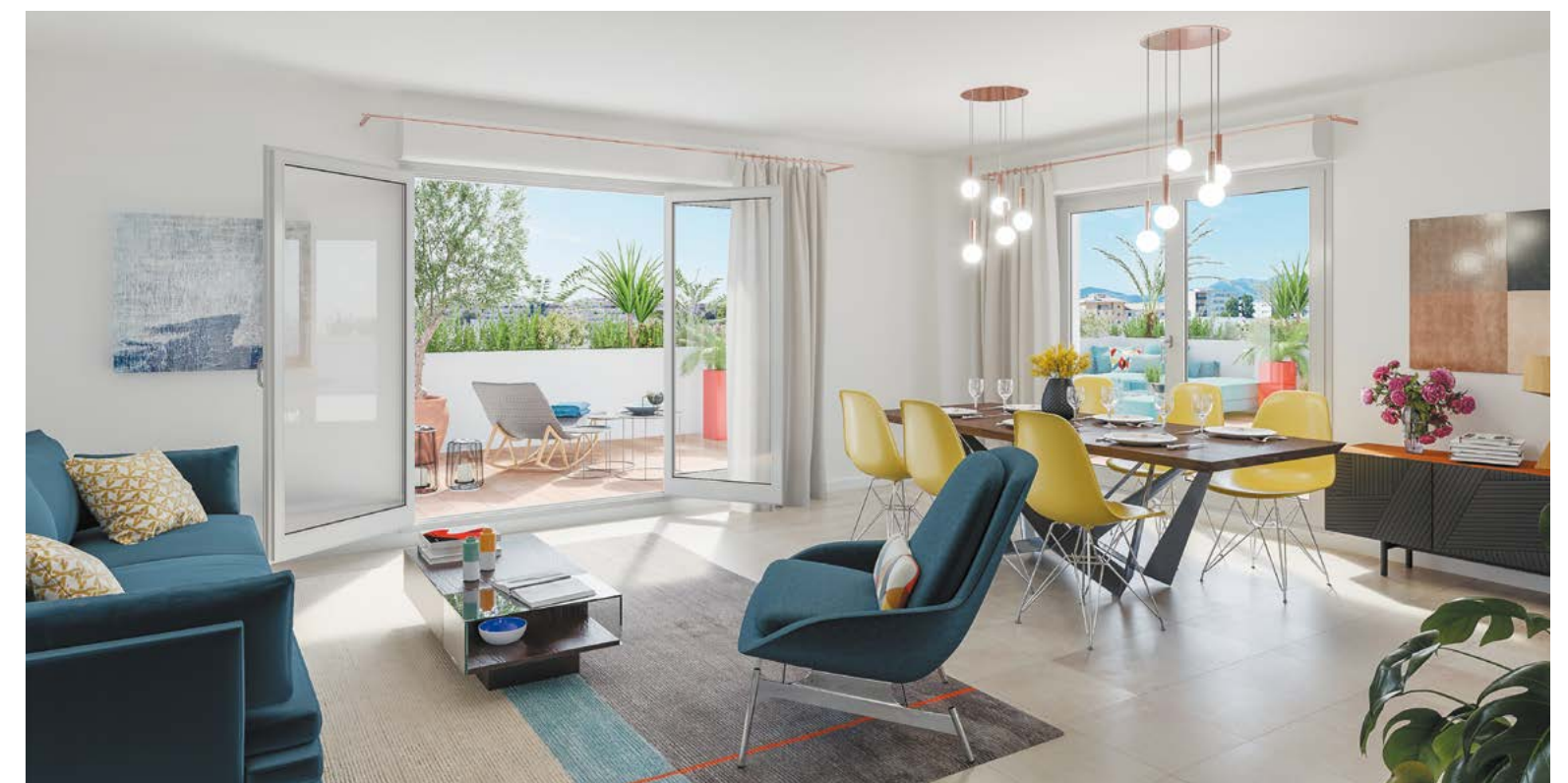
Vue intérieure d'un appartement