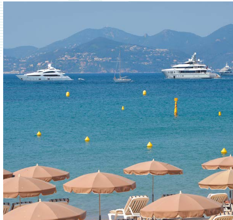
La Baie de Cannes devant le massif de l'Estérel

A l'Ouest de la cité des festivals, Cannes-la-Bocca est un quartier en plein devenir. Bordé au sud par de longues plages de sable avec une vue imprenable sur les roches rouges de l'Estérel, les îles de Lérins et le golfe de la Napoule, c'est un lieu de vie idéal mêlant nature et ville. Vous êtes à deux pas de la célèbre Croisette, mais aussi des forêts de pins et de mimosas. Entre culture et nature verdoyante, vous n'aurez qu'à vous laisser guider par vos envies.