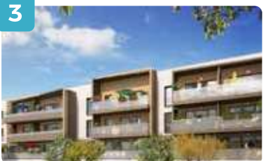
Vue bâtiment F