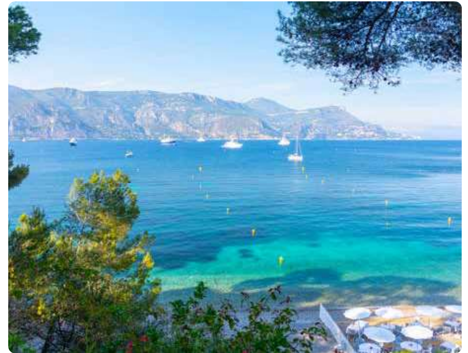
La côte du Var et ses nombreuses plages et criques

Avec plusieurs filières d'excellence dans les technologies marines et de la défense implantées dans la métropole de Toulon, le Var mise aussi sur les industries de demain pour renforcer son attractivité.