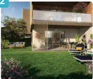
Vue jardin bâtiment A