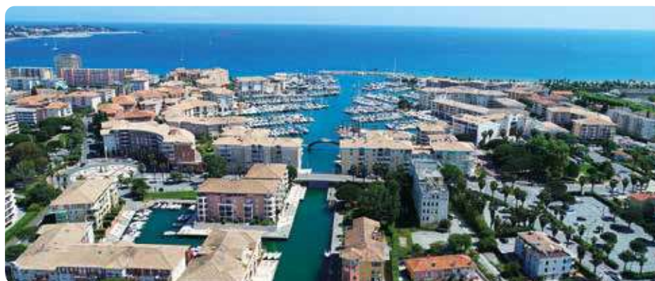
Le port de Fréjus

29 sites protégés aux Monuments historiques