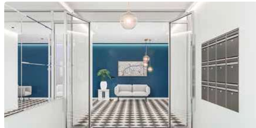
Exemple de hall sécurisé