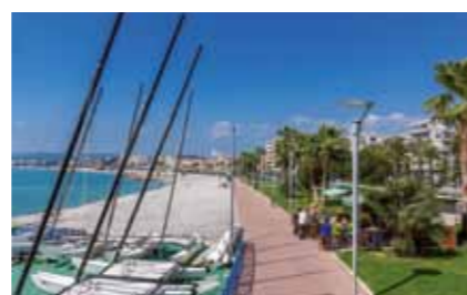
Promenade de la plage.