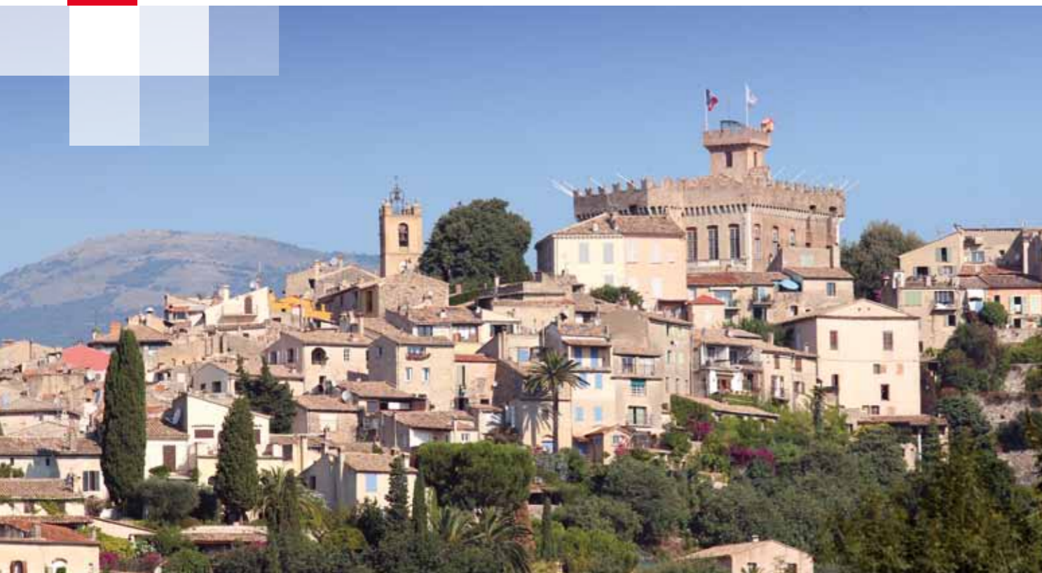
Château-Musée Grimaldi dominant la mer dans le quartier Le Haut-de-Cagnes.