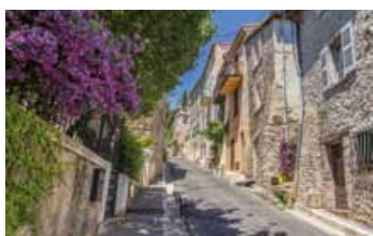
Ruelle du bourg médiéval dans Le-Haut-de-Cagnes.