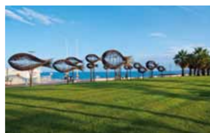
« Le Banc de Poissons », sculpture de Sylvain Subervie.