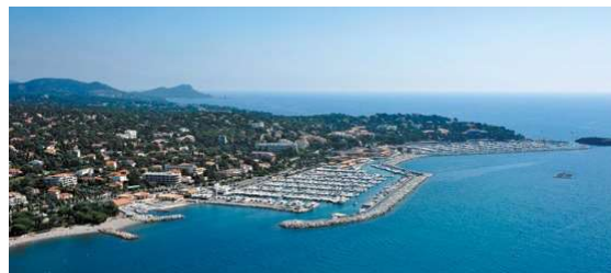
La Baie de Saint-Raphaël