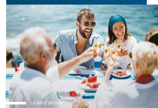
Le bord de mer

Sur la côte varoise, Saint-Raphaël concilie à merveille la générosité naturelle de la Provence et l'ambiance chic de la Côte d'Azur. Vous y apprécierez la douceur de vivre du littoral, l'animation festive de la station balnéaire et le charme préservé de la nature environnante. Et tout cela, à moins d'une heure de Cannes, Antibes, Saint-Tropez, Nice et son aéroport international.