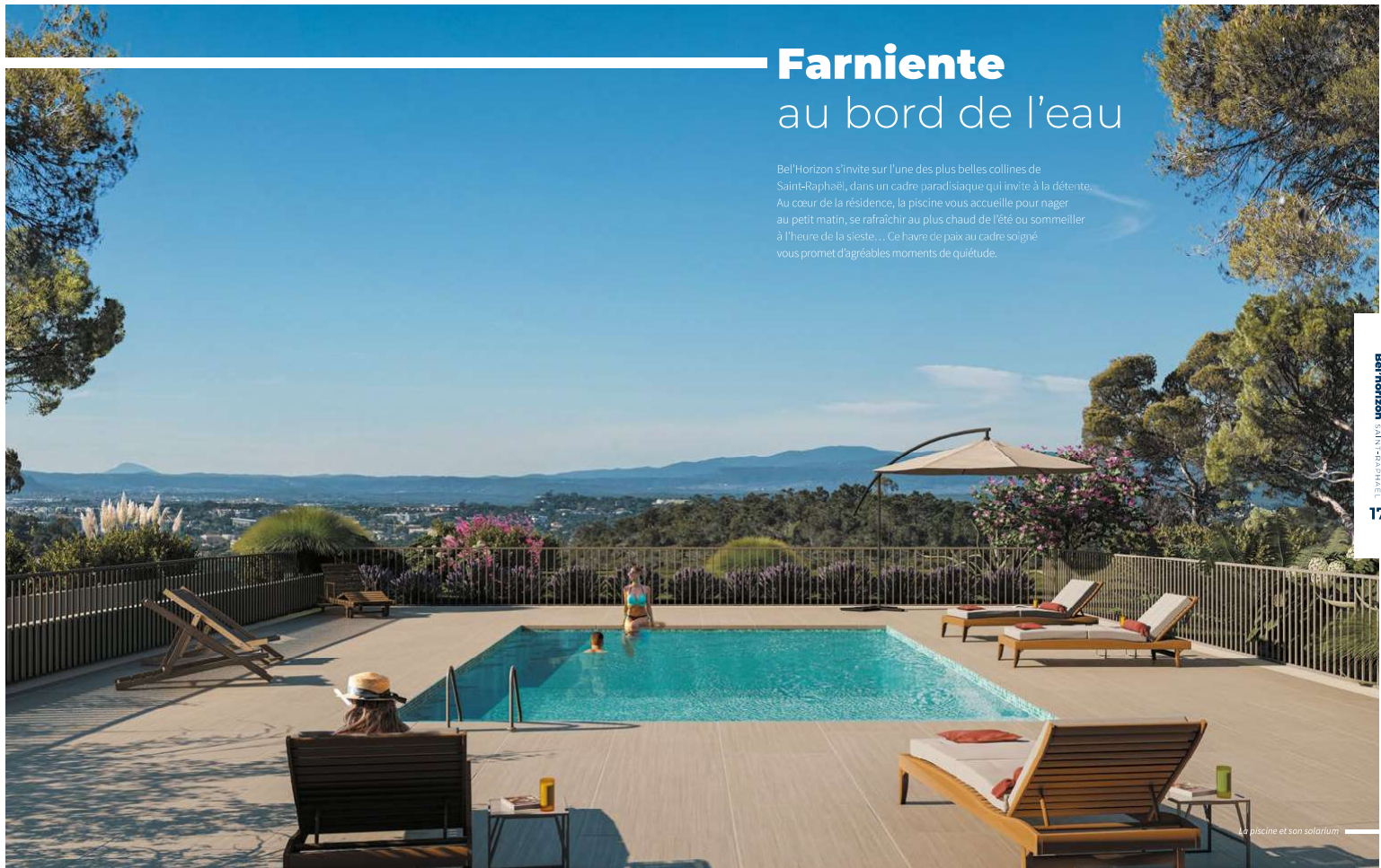
La piscine et son solarium

Bell'Horizon s'invite sur l'une des plus belles collines de Saint-Raphaël, dans un cadre paradisiaque qui invite à la détente. Au cœur de la résidence, la piscine vous accueille pour nager au petit matin, se rafraîchir au plus chaud de l'été ou sommeiller à l'heure de la sieste... Ce havre de paix au cadre soigné vous promet d'agréables moments de quiétude.