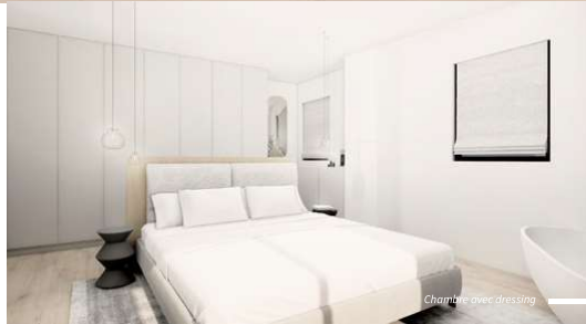
Chambre avec dressing