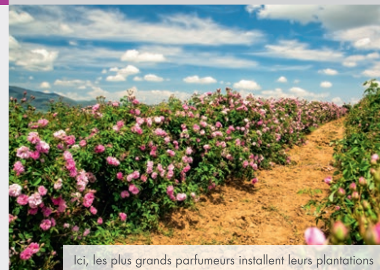
Ici, les plus grands parfumeurs installent leurs plantations

À 15 minutes* de la technopole de Sophia Antipolis et ses 36 300 emplois (3)