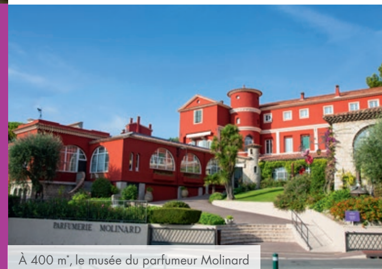
À 400 m*, le musée du parfumeur Molinard

À 4 min* en voiture, centre historique, marché provençal, musée international de la parfumerie