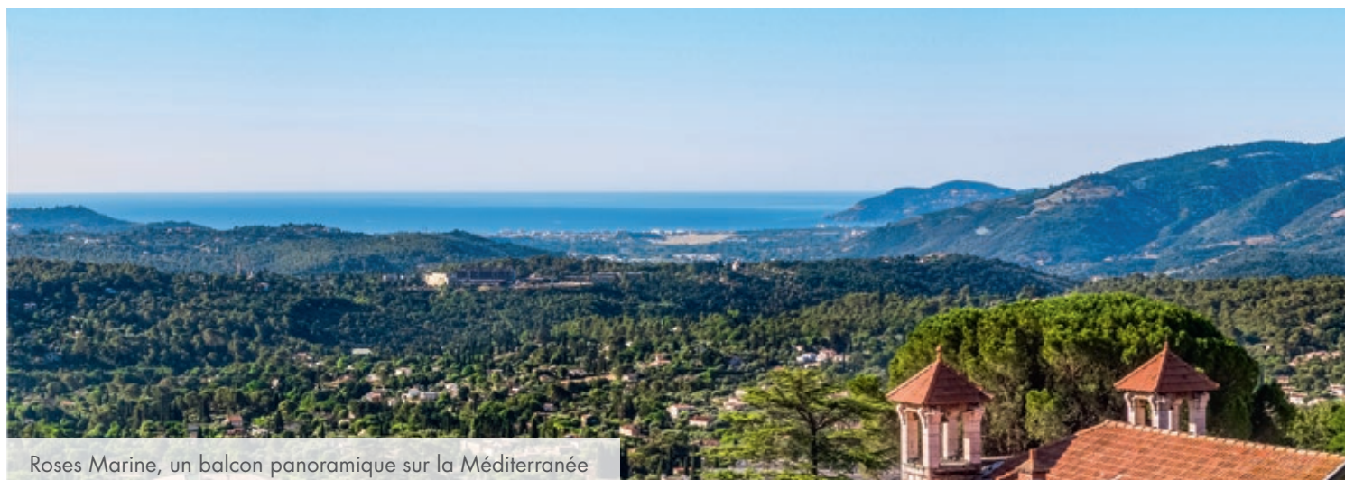
Roses Marine, un balcon panoramique sur la Méditerranée