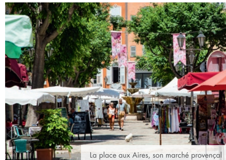
La place aux Aires, son marché provençal

Capitale mondiale des parfums, elle insuffle dynamisme économique, scolaire, culturel et environnemental. Il fait bon vivre, investir ou avoir un pied-à-terre en pays grassois !