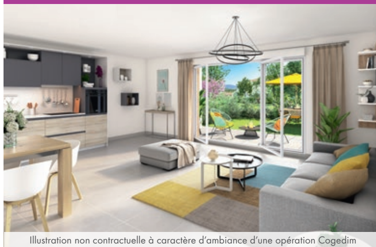
Illustration non contractuelle à caractère d'ambiance d'une opération Cogedim