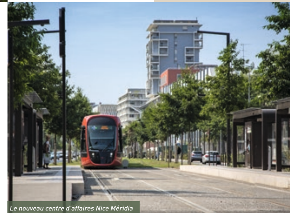
Le nouveau centre d'affaires Nice Méridia

Capitale économique, Nice mène des projets de développement d'envergure, à l'instar de l'OIN Éco-Vallée, rassemblant le centre d'affaires Nice Grand Arénas et la technopole Méridia, le nouveau palais des congrès... Côté transports, la future gare multimodale complètera une offre exhaustive, centralisée au sein du nouveau hub Nice Saint-Augustin-Aéroport. Résolument portée par l'innovation, Nice est parmi les 15 « smart cities » les plus performantes du monde, grâce à une excellente gestion de l'énergie et des mobilités intelligentes.