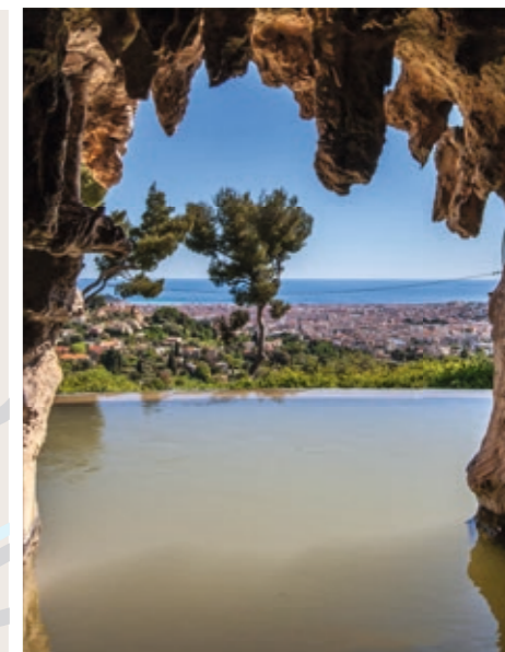
La cascade de Gairaut face à la Baie des Anges

« Une adresse de charme, dans la verdure et proche du centre, l'assurance d'une qualité de vie rare et d'un patrimoine pérenne. »