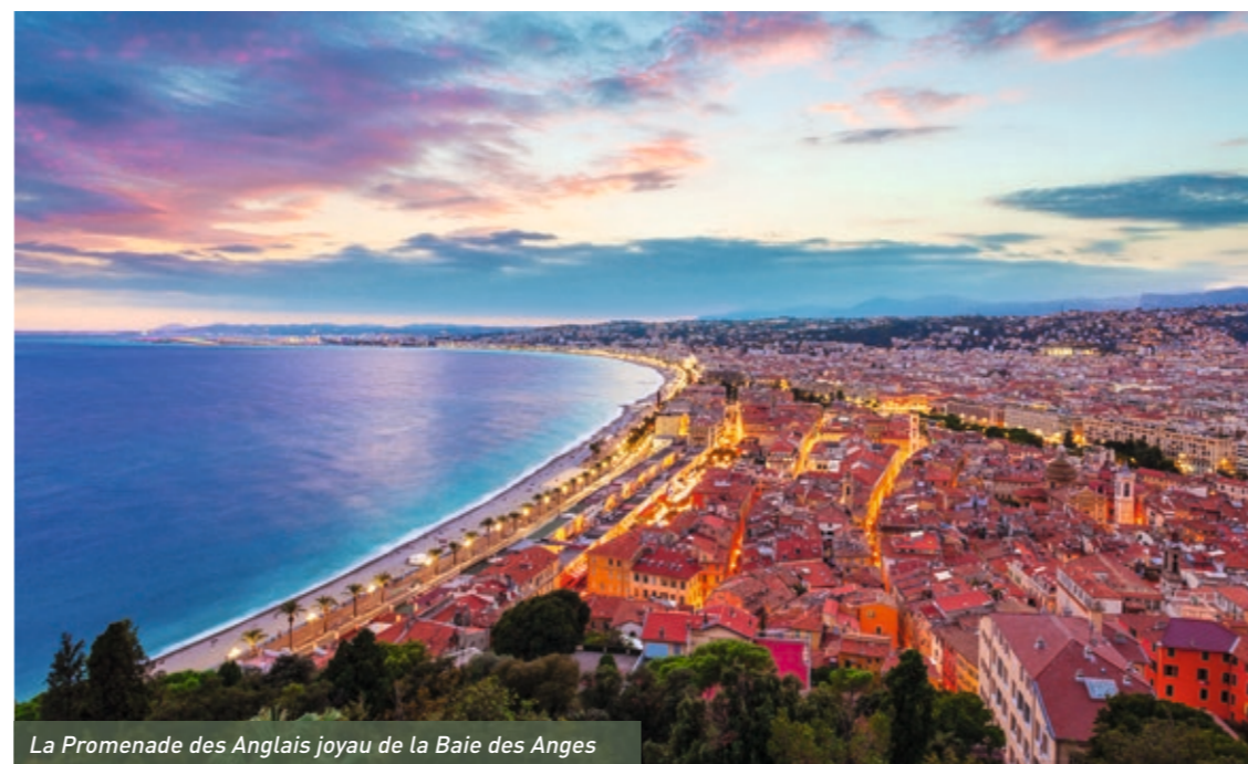
La Promenade des Anglais joyau de la Baie des Anges

L'histoire millénaire de Nice lui a façonné une physionomie envoûtante, multiple, qui fait sa renommée dans le monde entier. Cette attractivité touristique va de pair avec un rayonnement économique puissant : capitale de la Côte d'Azur, Nice est une ville active où il fait bon séjourner, étudier et travailler.