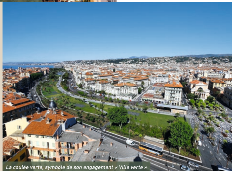
La coulée verte, symbole de son engagement « Ville verte »