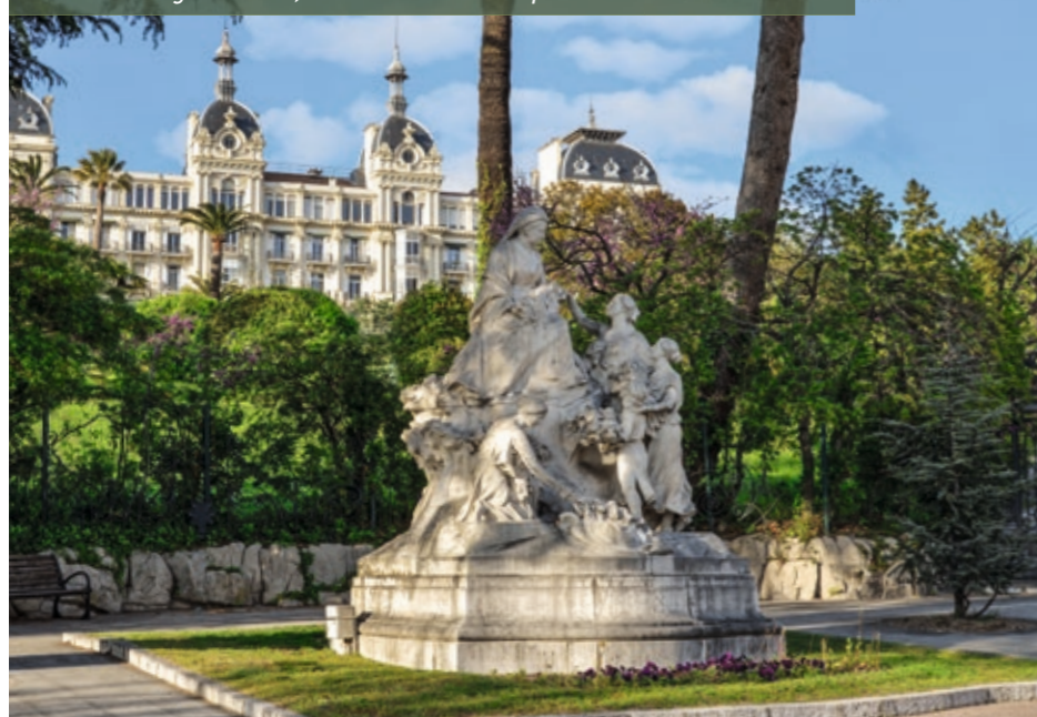
L'Excelsior Regina Palace, ancien hôtel de luxe qui accueillit la reine Victoria

Nice a toujours eu deux visages, complémentaires. Déjà sous l'Antiquité, les Romains avaient investi les collines, et les Grecs le bord de mer, avec Nikaïa. Entre Gairaut et Cimiez, la colline de Rimiez embrasse du regard la baie des Anges et les collines niçoises, alliant centralité et panorama époustoufflant. Une situation résidentielle recherchée pour sa qualité de vie sereine et pratique pour le plus grand bonheur de toute la famille.