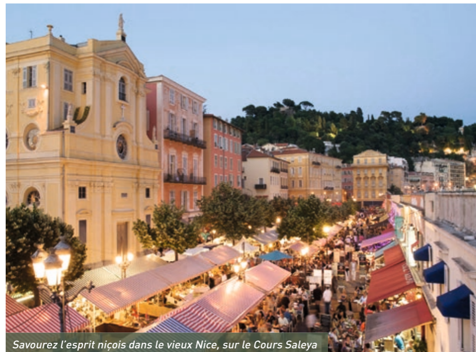
Savourez l'esprit niçois dans le vieux Nice, sur le Cours Saleya