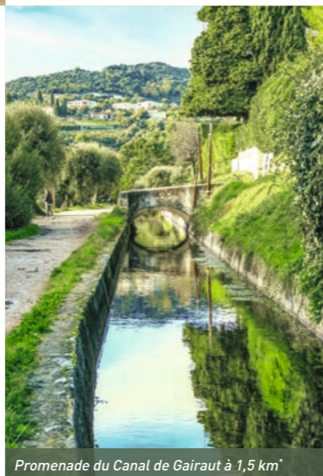
Promenade du Canal de Gairaut à 1,5 km