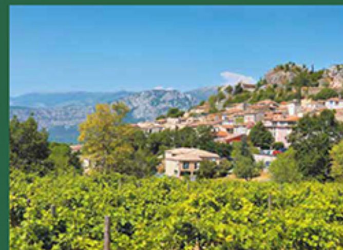
Vue sur l'ancien village d'Aiguines

Entre mer et collines, faites le choix d'un environnement préservé, où la tradition du bien vivre s'apprécie à chaque instant.