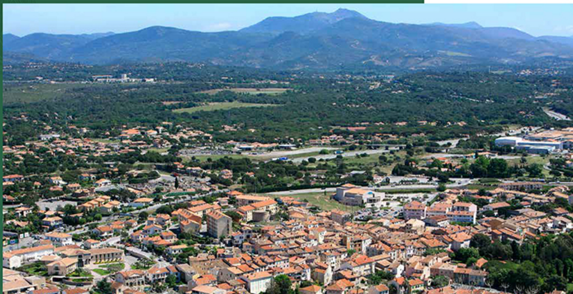
Vue aérienne de Puget sur Argens

Ambitieuse, Puget-sur-Argens ne se limite pas à la beauté de son cadre de vie. La commune a su évoluer avec son époque en se dotant de belles structures culturelles et d'une riche programmation événementielle. Randonnées pédestres, vie associative animée, équipements sportifs... Les activités ne manquent pas pour rester actif et se divertir. L'attrait et le dynamisme économique se manifestent dans les différentes zones d'activités alentours mais aussi dans les nombreux commerces de proximité facilitant le quotidien de tous. Enfin, la ville se dote d'une entreprenante politique urbaine et environnementale pour s'assurer d'un avenir radieux.