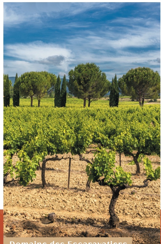
Domaine des Escaravatières

Calme et résidentiel, facilement accessible en voiture, il se trouve à proximité de toutes les commodités, à 4 minutes* à pied du centre-ville et à 15 minutes* en voiture du bord de mer.