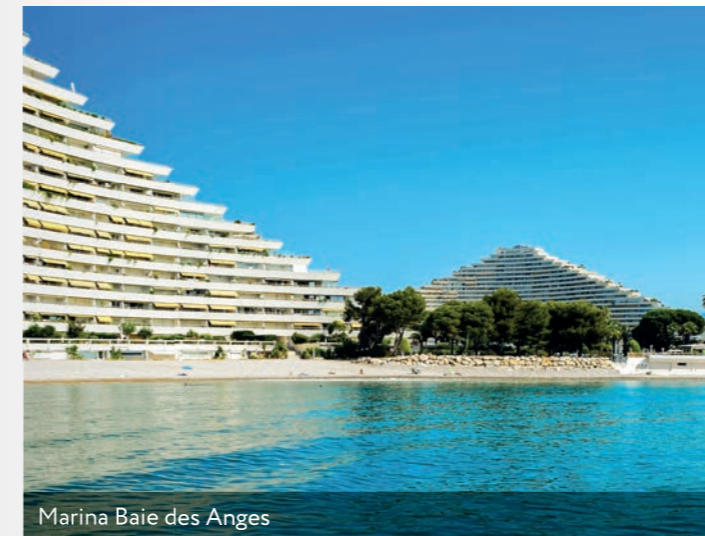
Marina Baie des Anges

Associant deux ambiances distinctes, côté terre et côté mer, la ville a su offrir un programme culturel, sportif et associatif de qualité pour tous. Des équipements performants, une vie de proximité autour des commerces locaux et de nombreuses animations ainsi que des événements participants à une réelle harmonie collective. Résolument tournée vers son avenir, la ville se dote également de beaux projets urbains et environnementaux, avec le bien-être de ses habitants comme seul objectif.