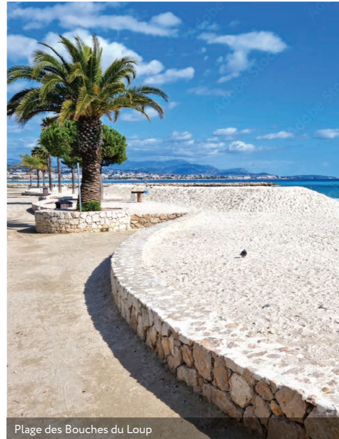
Plage des Bouches du Loup

Entre mer et collines, marina moderne et centre-historique, Villeneuve-Loubet est une perle de la Côte d'Azur. Surnommée le "cœur nature" de la région, cette station balnéaire allie l'authenticité de son héritage à un littoral qui se distingue par son incroyable beauté. Avec ses parcs naturels préservés et son riche patrimoine historique, Villeneuve-Loubet offre une douceur de vivre rare à ses 16 000 habitants (1) .