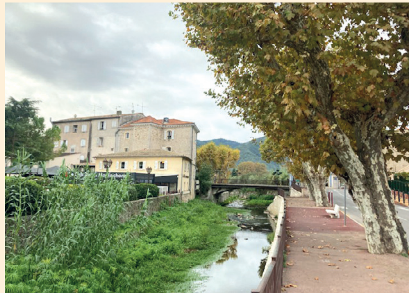
Sur les bords de la Mourachone