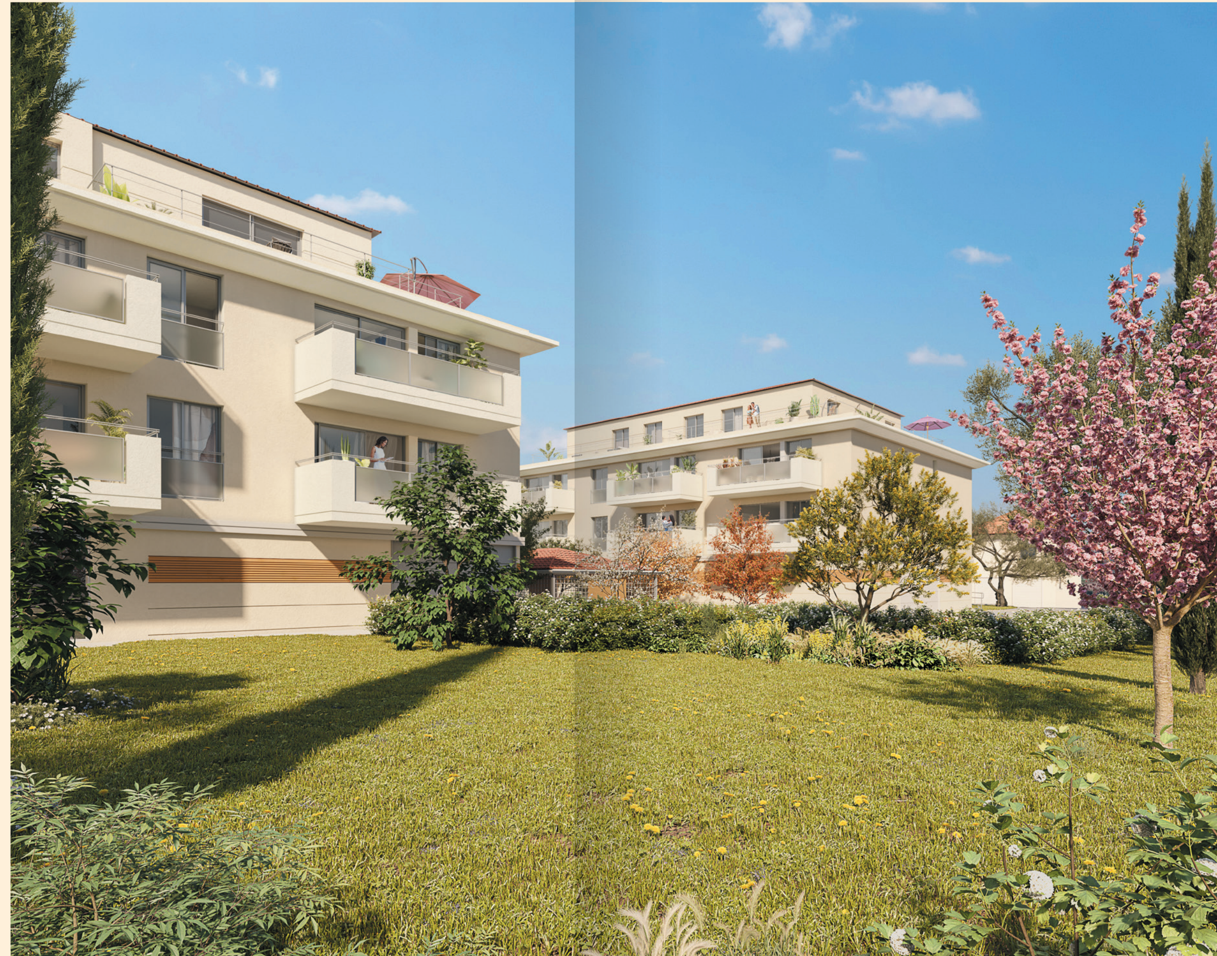
Vue depuis le Cœur d'îlot