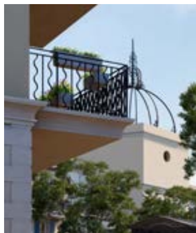
Balcons et éléments de serrurerie

Depuis toujours, la halle est un des principaux édifices publics organisant l'espace social de la cité. Anciennement en bois, nombre d'entre elles ont profité, à compter du XIX e siècle, de l'architecture du fer, accompagnant l'avènement de la civilisation industrielle, des progrès techniques et des ingénieurs-constructeurs tels que Gustave Eiffel.