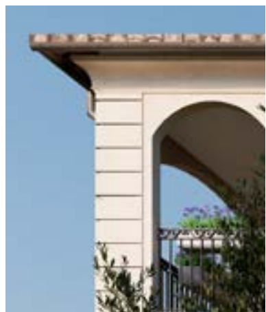
Pierre en chaînages d'angle

À l'image du campanile, rendant hommage aux anciens clochers méridionaux, les balcons ouvragés de Cœur Village reprennent également les codes de l'architecture régionale. La sobriété classique des grilles du début du XVIII e siècle a fait place au fil du temps à la fantaisie des motifs ornementaux (style rocaille, feuillages, éléments géométriques...).