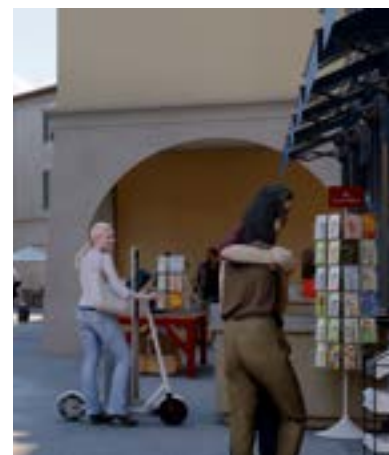
Arcades en séquences

La pierre a été utilisée de tout temps pour façonner et fortifier les encoignures des constructions à la jonction de 2 murs. Réalisés en pierre ou en parement de pierre, ces éléments fonctionnels ajoutent aujourd'hui encore aux qualités esthétiques d'une réalisation.