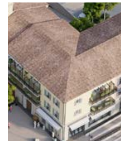
Toitures en tuiles de coloris panachés

Jusqu'au XVIII e siècle, avant la généralisation des vitrages, des panneaux en bois protégeaient les ouvertures des habitations des intrusions, de la pluie et du vent. Typiques de la région, les volets à la « niçoise » sont idéalement adaptés au climat : ils préservent du rayonnement solaire direct, tout en favorisant une ventilation naturelle et un apport de lumière en intérieur.