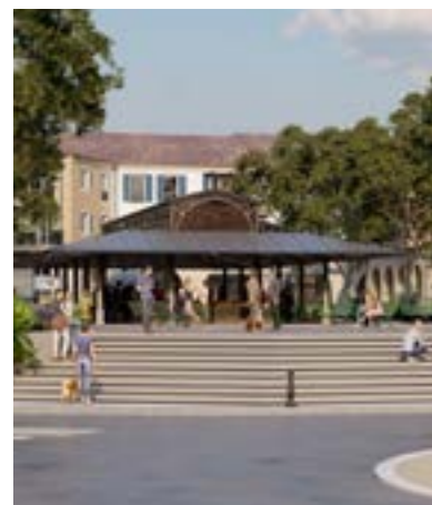
Halle de marché avec structure métallique

comme la pierre, le bois ... Des espaces publics agréables marqués par les mobilités douces et l'omniprésence du végétal... Rien de tel que du vrai pour faire du vrai ! Ce projet offre à la commune un nouveau centre de vie révélant une vraie qualité d'usages et dégageant un sentiment d'intemporalité, de sérénité.