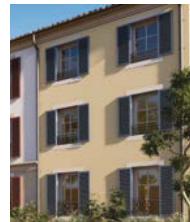
Volets battants à la « niçoise »

Il y a des millions d'années, le retrait de la mer a donné naissance à des sables ocreux et à des panoramas spectaculaires de roches déclinant toutes les couleurs du soleil. Les pigments naturels sont utilisés depuis la préhistoire, comme en témoignent pour exemple les peintures rupestres.