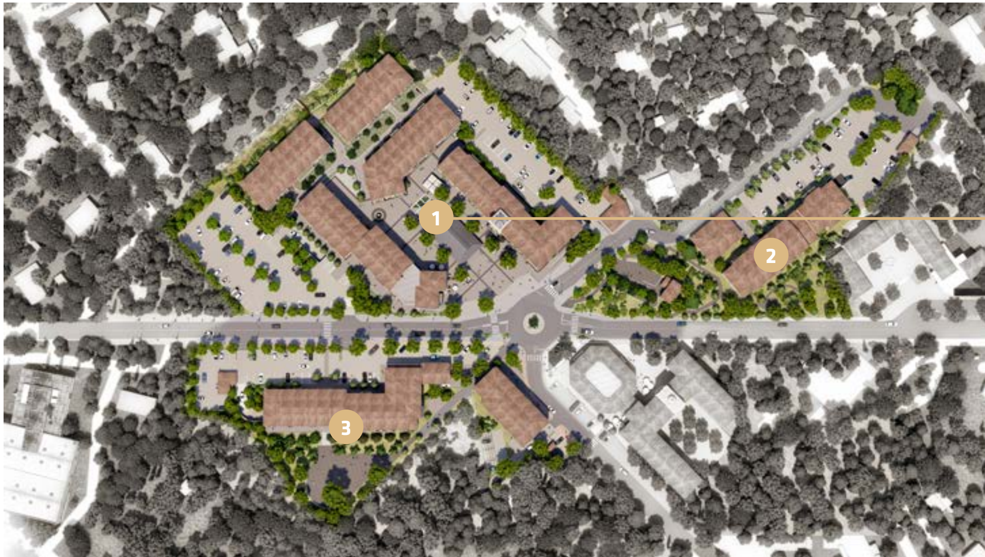
1 La Place du Village