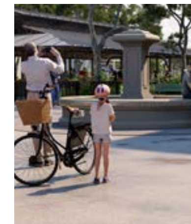
Place du village

Les toitures flamboyantes en tuiles de terre cuite font partie du paysage architectural méridional depuis des siècles. D'abord importées par les Grecs, en provenance d'Orient, elles ont ensuite été reprises par les Romains. Dès le XVII e siècle, les génoises ont été amenées par les maçons de Gênes en Provence, avant de s'étendre à tout le sud de la France.