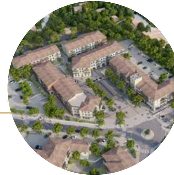
3 Le Verger