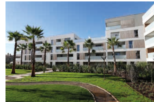
Le Jardin de Matisse - Saint-Laurent-du-Var Architecte : Cabinet Es-Pace