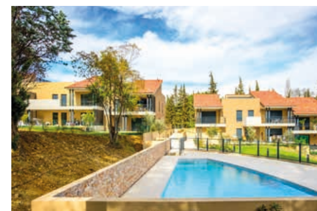
Les Jardins de Valmasque - Mougins Architecte : ABC Architectes