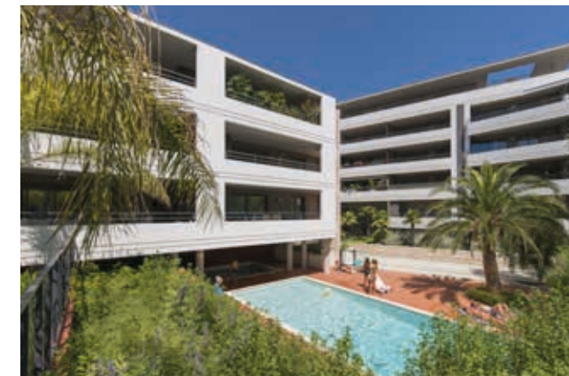
28, Montfleury - Cannes Architecte : ABC Architectes